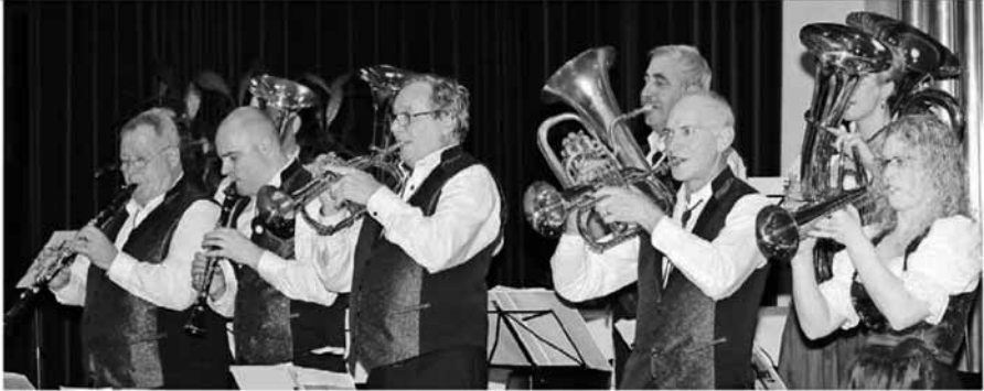
Beschwingt, mit gehobener Spielkultur: Das Benefizkonzert der Sarganserländer Musikanten zugunsten von Hospizgruppe Sarganserland war für alle Beteiligten ein Erfolg.

Dieses Jahr wurde das Konzert zum zweiten Mal in der Kantonsschule Sargans durchgeführt. Lesen Sie dazu den Zeitungsbericht von Ignaz Good, welcher im Sarganserländer erschienen ist. Den kompletten Artikel finden Sie auf unserer Internetseite – www.slm-musikanten.ch .