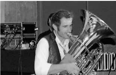
Kobis Solo auf dem Weg Richtung CD. Der Tontechniker hält sich als stiller Schaffer im Hintergrund.

Ein kleines Projektteam aus unseren Reihen traf anschliessend eine Vorauswahl aus diesem Live-Mitschnitt. Es ging dabei um den Entscheid, welche Titel ihren Weg auf die Silberlinge finden sollen. Erklärtes Ziel unserer CD-Produktion ist es nämlich, Ihnen einen Querschnitt unseres aktuellen musikalischen Standes als Visitenkarte abzugeben. So bestand dann auch die Nachbearbeitung im Tonstudio lediglich aus dem Festlegen der definitiven Auswahl und deren Abspielreihenfolge auf der CD. Auf eine technische Nachbearbeitung haben wir verzichtet. Es wurden keine Filter gesetzt, nichts zusammengeflickt und schon gar nichts retuschiert!